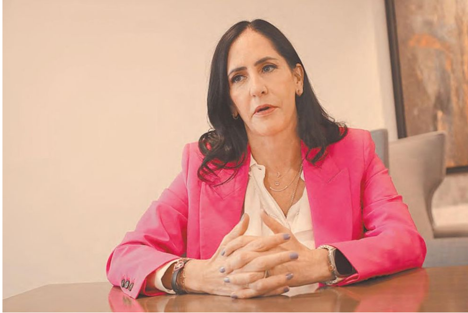
El Tribunal Electoral de la Ciudad de México tiene como límite para resolver impugnaciones el 1 de agosto, 30 días antes de la toma de posesión del cargo.