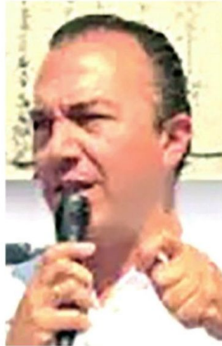
Huyó de la capital del país en 2015