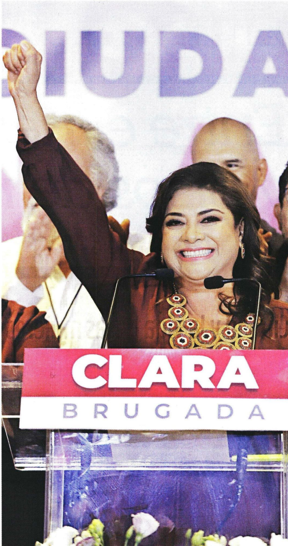
LA NUEVA TITULAR. Clara Brugada se convertirá en la segunda Jefa de Gobierno que tiene la Ciudad de México.