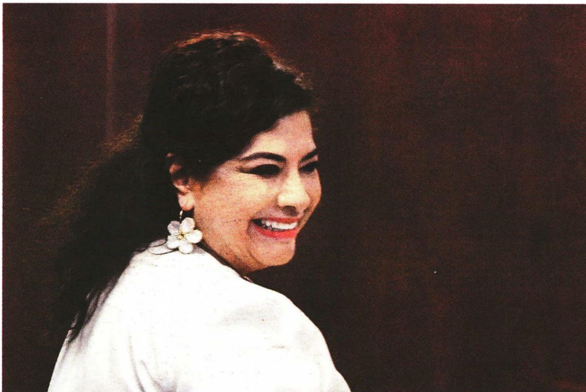
Con una trayectoria política de 40 años, rinde protesta este sábado.