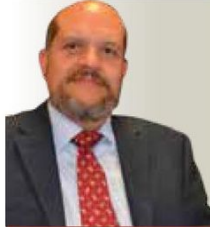
POR JULIÁN ANDRADE

Solo dos senadores requerirán en Morena para completar la mayoría calificada en el Senado de la República.