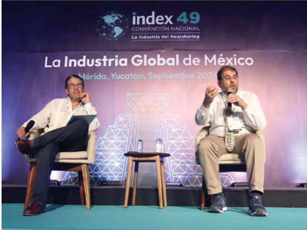
● ESCENARIO. La Index 49 Convención Nacional se lleva a cabo en Mérida, Yucatán.