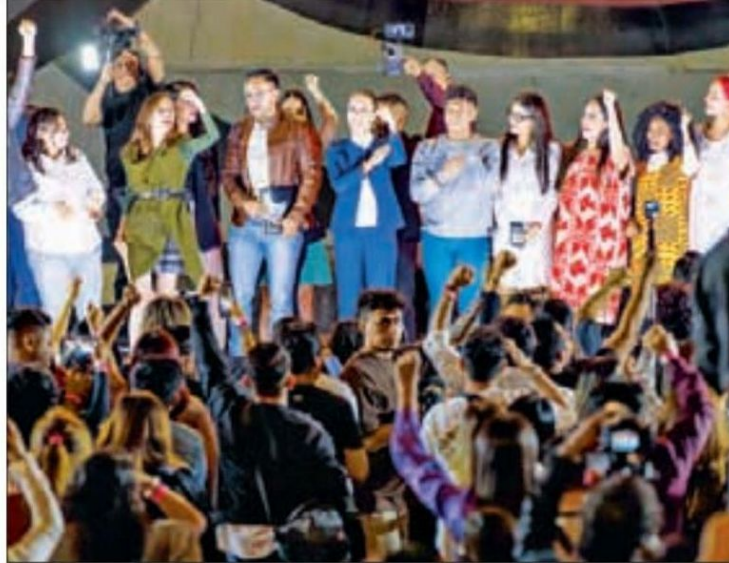
▲ Claudia Sheinbaum se reunió ayer con jóvenes en el Polyforum Siqueiros.