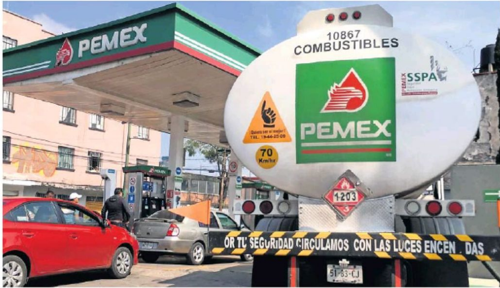
Los precios de los combustibles son los más altos en la historia, indican datos oficiales.