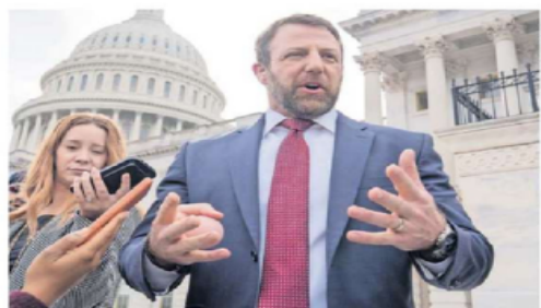
La nominación del senador Markwayne Mullin como secretario de Seguridad Nacional debe recibir aval del Senado estadounidense.