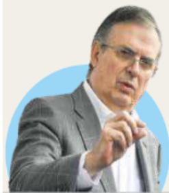
MARCELO EBRAED Secretario de Economía

“Hemos llegado a un acuerdo con mi contraparte de EU para iniciar a partir del 16 de marzo”.