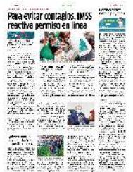
CAMPAÑA. En el país se han vacunado un millón 290 mil 903 niñas y niños de 5 a 11 años.