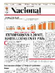
Gráfico: Alejandro Gómez