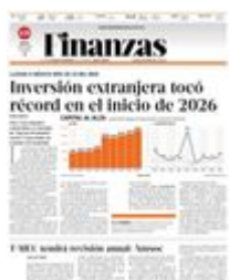
Gráfico: Rodolfo Gómez García