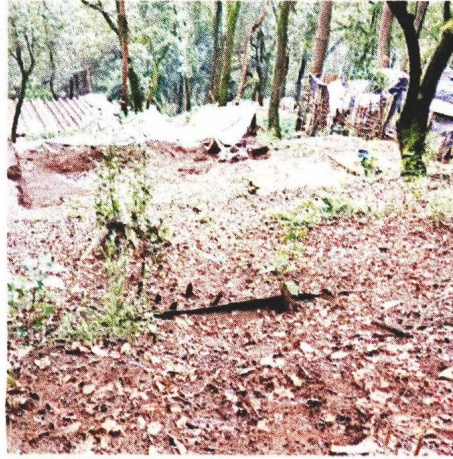
BAJO AMENAZA. Materiales de construcción habían sido vertidos en la zona.