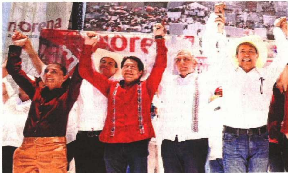
Claudia Sheinbaum, Mario Delgado, Adán Augusto López y Ricardo Monreal participaron en una "asamblea informativa" organizada por Morena en Coahuila.

Sin la presencia de Marcelo Ebrard, por contagio de Covid, la jefa de Gobierno dijo que la unidad se hace con base en la lealtad y que nadie debe regatear nada a la transformación de México. Adán Augusto López, secretario de Gobernación, afirmó que no es momento de debates políticos, sumisión o rebeldía.