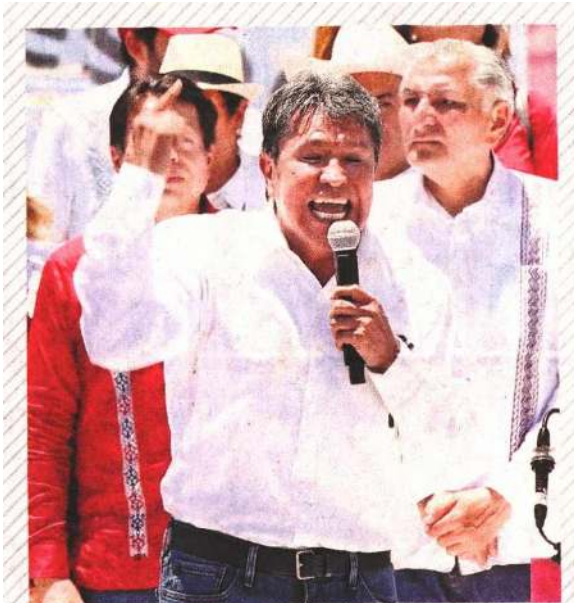
Ricardo Monreal Ávila pidió mantener la unidad y la cohesión, "y que ésta no sea ficticia".