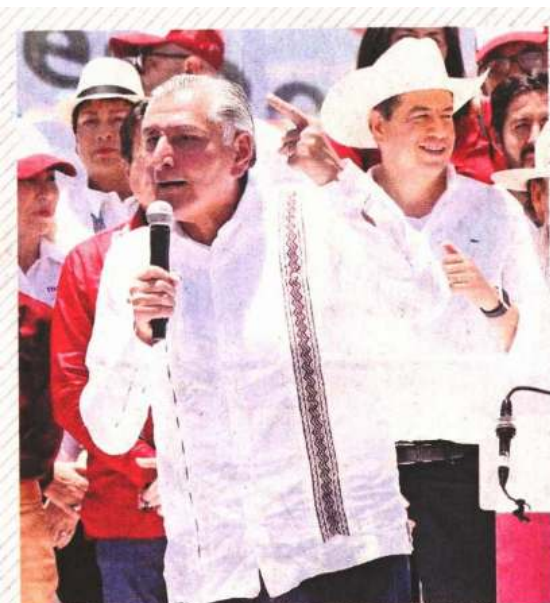
Adán Augusto López dijo que vendrá más temprano que tarde el momento del relevo.