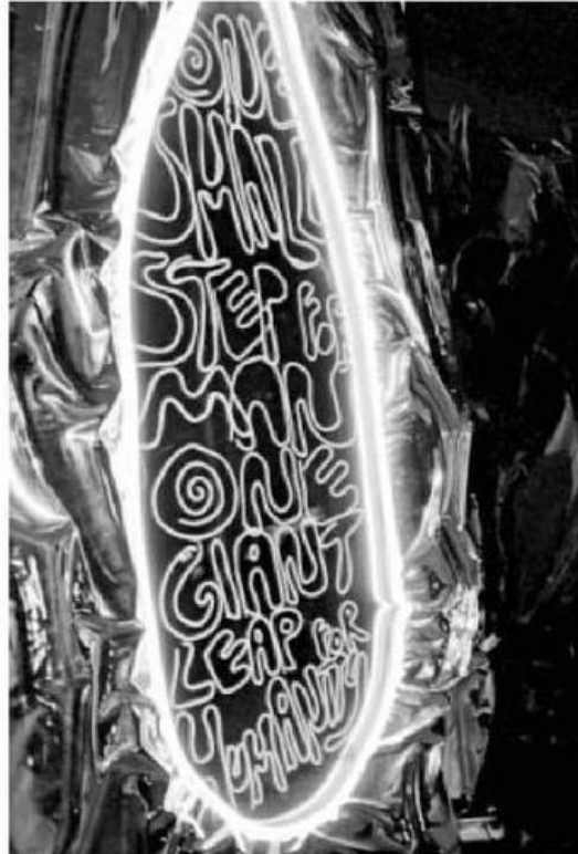
Esta es la primera exposición de arte que se realiza fuera de la Tierra