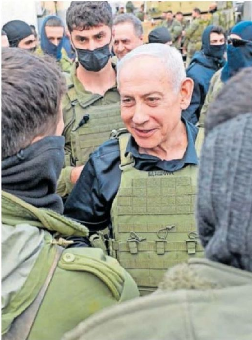
Benjamín Netanyahu, el domingo en el sur del Líbano.

El magistrado ha abierto diligencias previas, un trámite inicial