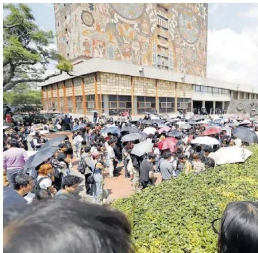
Convocaron para otra marcha hoy.