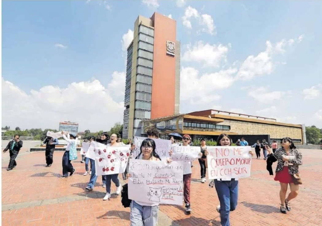
Los manifestantes portaban carteles con frases como "no me quiero morir en CCH Sur".