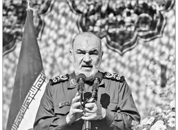
▲ Rescatistas buscan sobrevivientes en un edificio destruido por la aviación israelí en Teherán (izquierda); imagen de archivo del jefe del Cuerpo de Guardianes de la Revolución Islámica, Hossein Salami, abatido en el primer día de ataques de Tel Aviv.