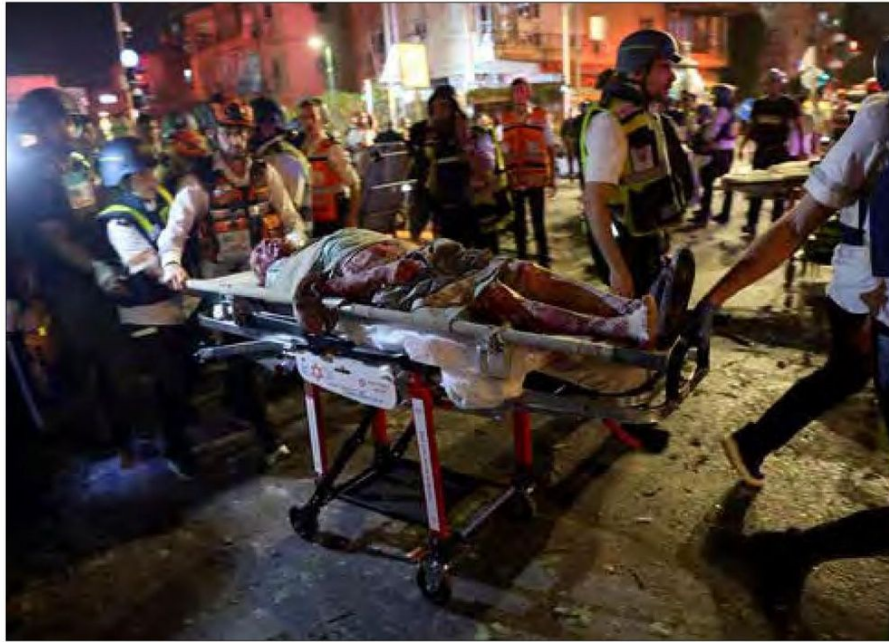
▲ Edificio alcanzado por un misil en Tel Aviv, donde el ministerio de Defensa fue dañado, y traslado de lesionados en Ramat Gan, cerca de esa ciudad. Debido a la escalada bélica, siguen al alza los precios del petróleo y el oro, así como la caída de las bolsas.