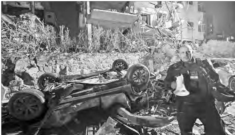
▼ Varios edificios, algunos que albergan oficinas oficiales, ubicados en el centro de la capital de Israel, fueron alcanzados por los cohetes lanzados por la república islámica.