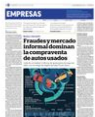
Gráfico: Ana Luisa González