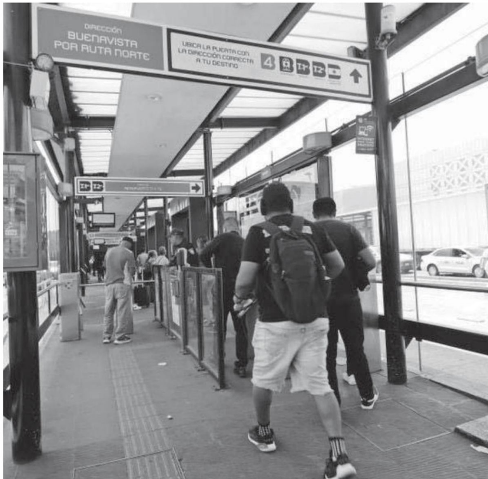
La línea 4 del Metrobús conecta a las terminales 1 y 2 en una hora y 40 minutos