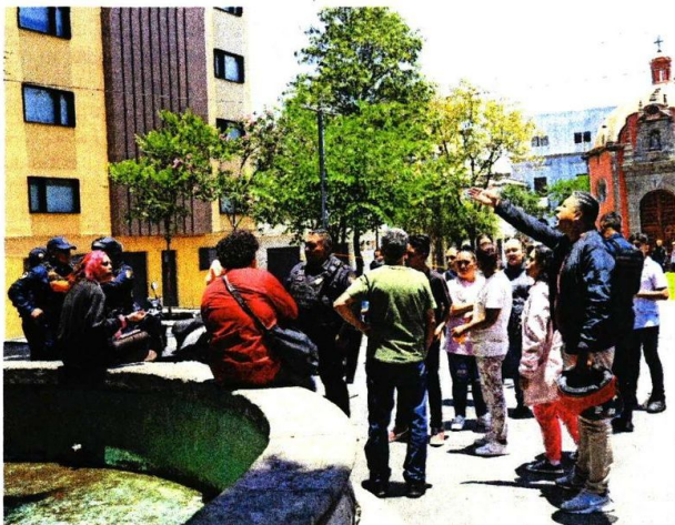
Policías intervinieron ante las protestas de vecinos en contra del campamento cannábico en la Plaza de la Concepción.