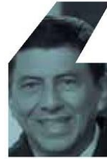
SALOMÓN JARA CRUZ GOBERNADOR DE OAXACA

El gobierno reafirma su respaldo a las personas afectadas, y mantiene seguimiento permanente, hasta la atención integral de la situación