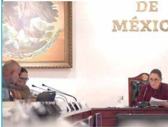
• CASO. Sheinbaum y Rosa Icela, en reunión.