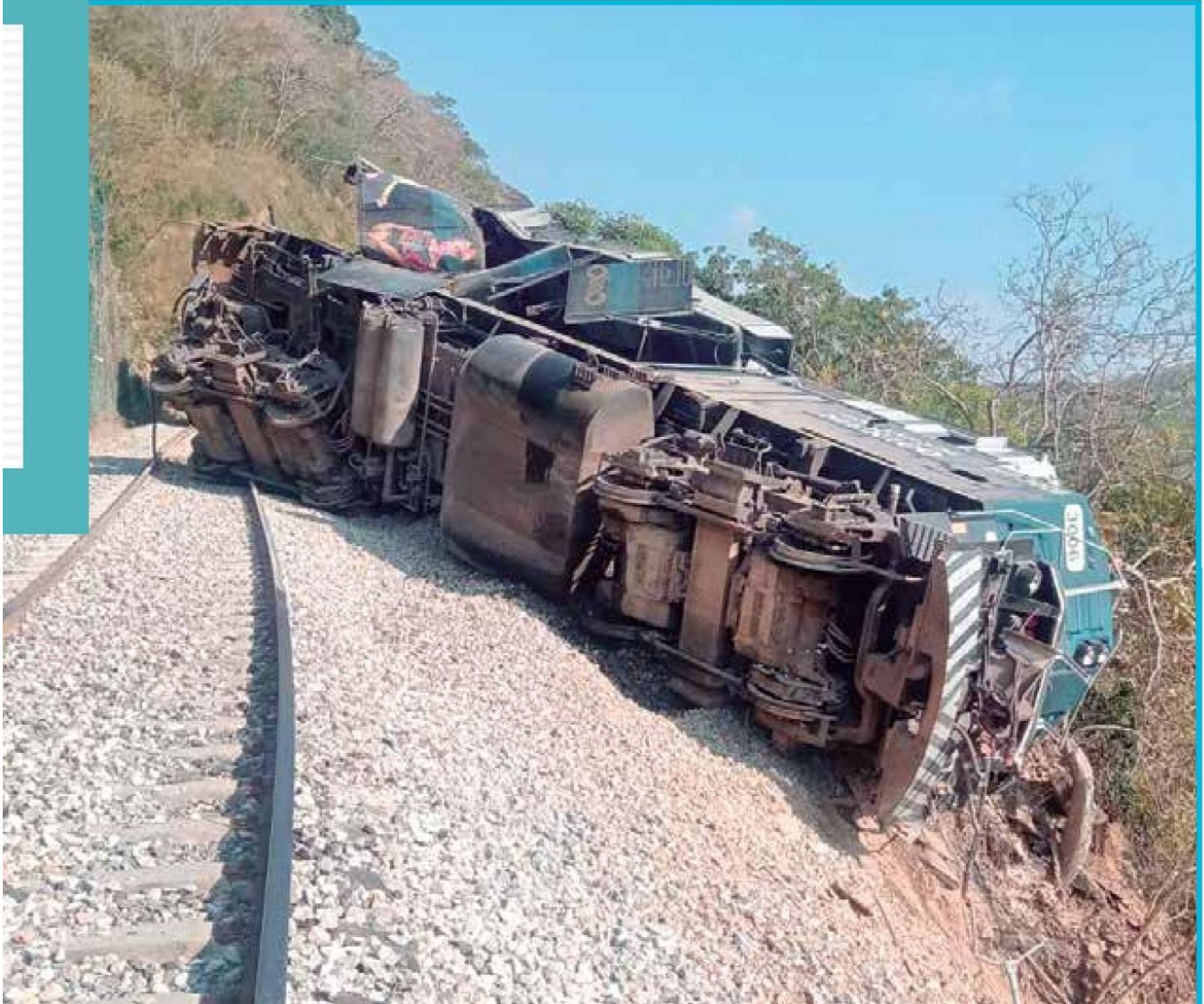
EMERGENCIA. La máquina principal se descarriló y uno de los vagones terminó en un barranco.