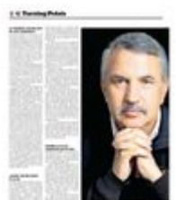
Thomas L. Friedman, dos veces ganador del Premio Pulitzer para The New York Times .