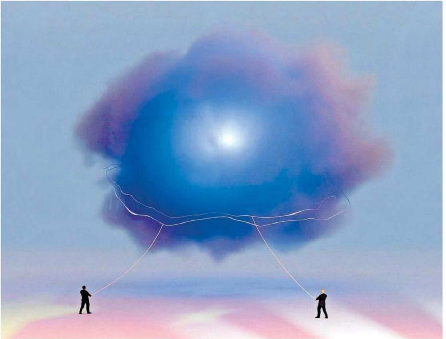
China y Estados Unidos aún no lo saben, pero la revolución de la inteligencia artificial los acercará más, en vez de separarlos.