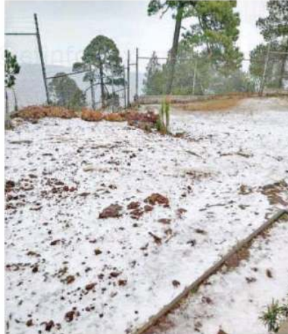
El Ajusco presentó después de las cinco de la tarde temperaturas muy bajas que causó que gran parte se vistiera de blanca nieve