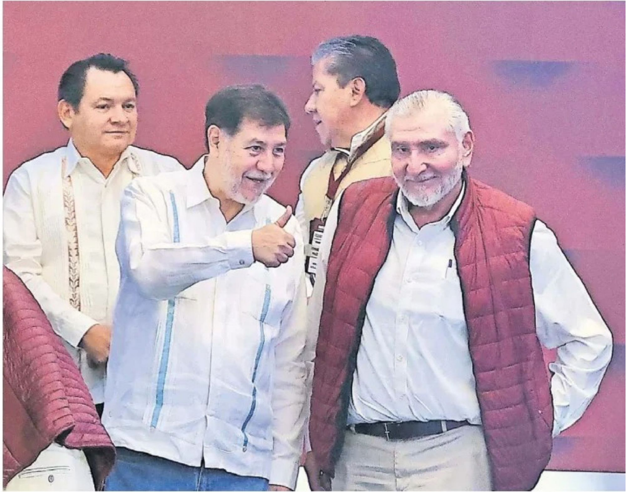
En el inicio de la sesión del Consejo Nacional de Morena, Adán López Hernández recibió el espaldarazo del partido.