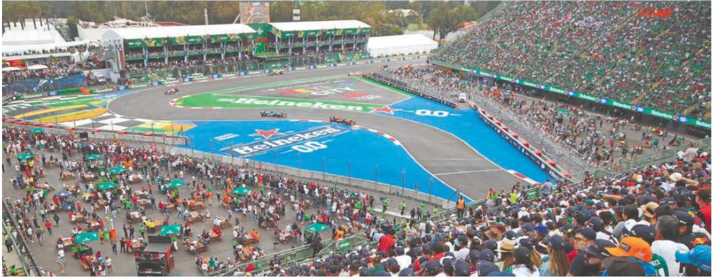
En la Fórmula 1 fueron presentados 73 revendedores ante el juzgado cívico