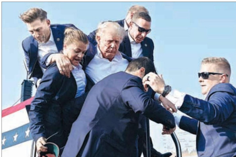
▲ En la imagen superior, los agentes del Servicio Secreto de Estados Unidos protegen a Donald Trump luego del atentado en el que una bala "perforó" su oreja derecha. Al centro, el magnate arenga a la multitud después de incorporarse una vez que cesaron los disparos. Abajo, es retirado del escenario por los agentes que lo llevaron a un hospital.