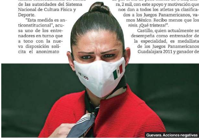
Guevara. Acciones negativas