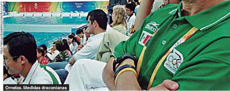
Ornelas. Medidas draconianas

En la modalidad de equipo o conjunto, rubro en el que entra la disciplina de fútbol, cuyo representativo nacional varonil ganó la medalla de bronce en los recientes Juegos Olímpicos Tokio 2020, cada uno de los jugadores obtendrá 13 mil pesos, con todo y su mediático logro. ▶