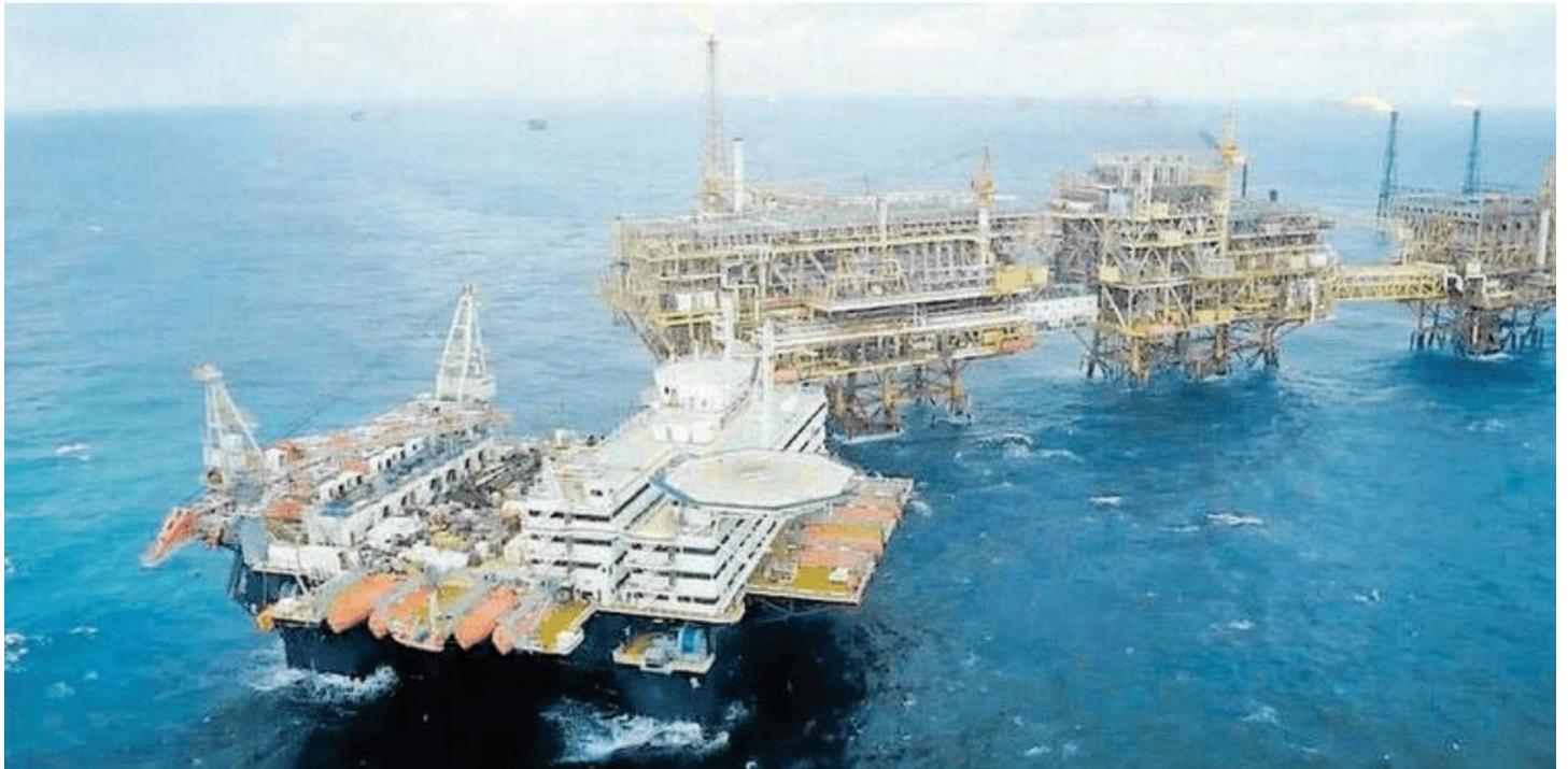
Oro Negro arrendaba plataformas petroleras a Pemex