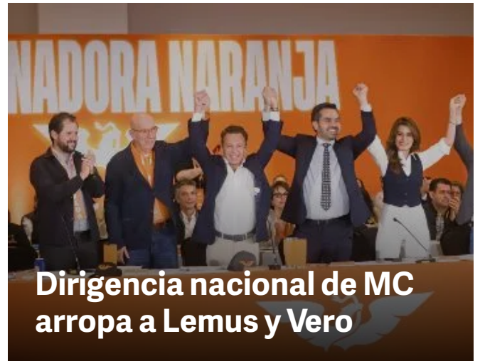
Dirigencia nacional de MC arropa a Lemus y Vero