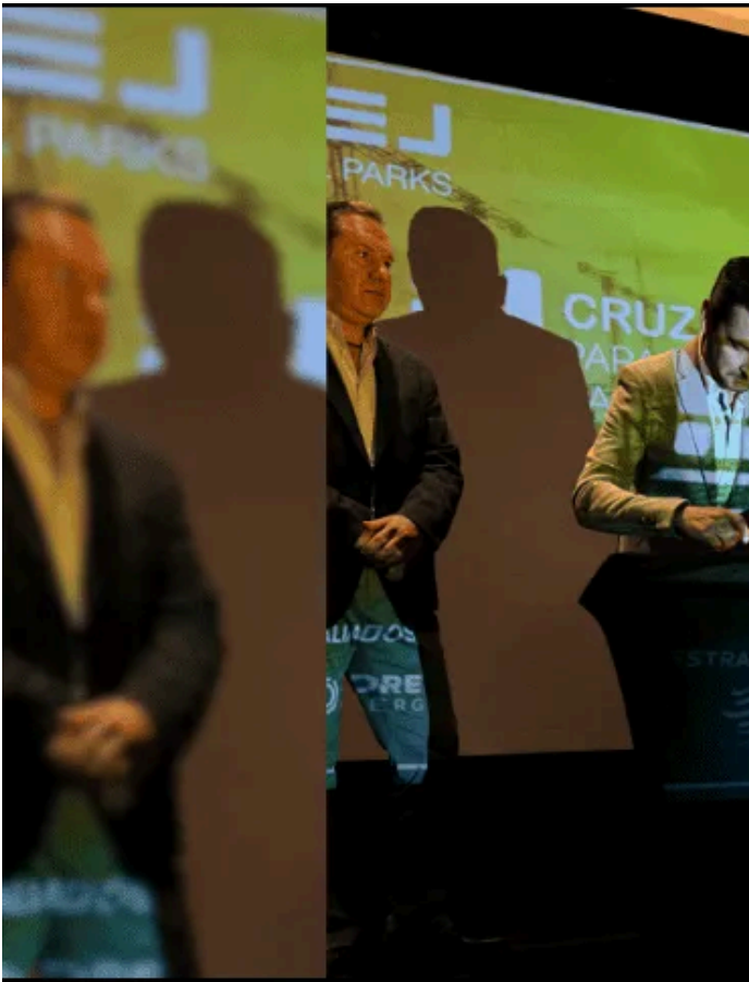
La cruzada es una iniciativa de la Asociación de Parques Industriales (APIEJ), la entidad de una mayor infraestructura inmobiliaria industrial en Jalisco. (