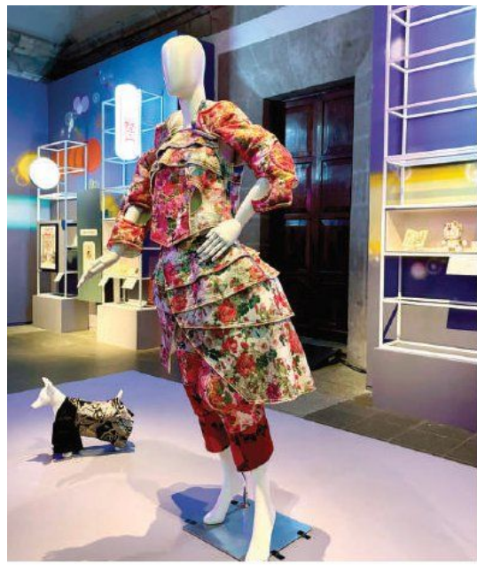
LA MODA NIPONA también forma parte de la exhibición en el Franz Mayer.