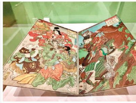
PÁRAMO, MOMOTARŌ (1855), de Utagawa Kuniyoshi.

DURANTE el recorrido podrás hacer tu origami, crear un manga y ver algunas producciones audiovisuales niponas.