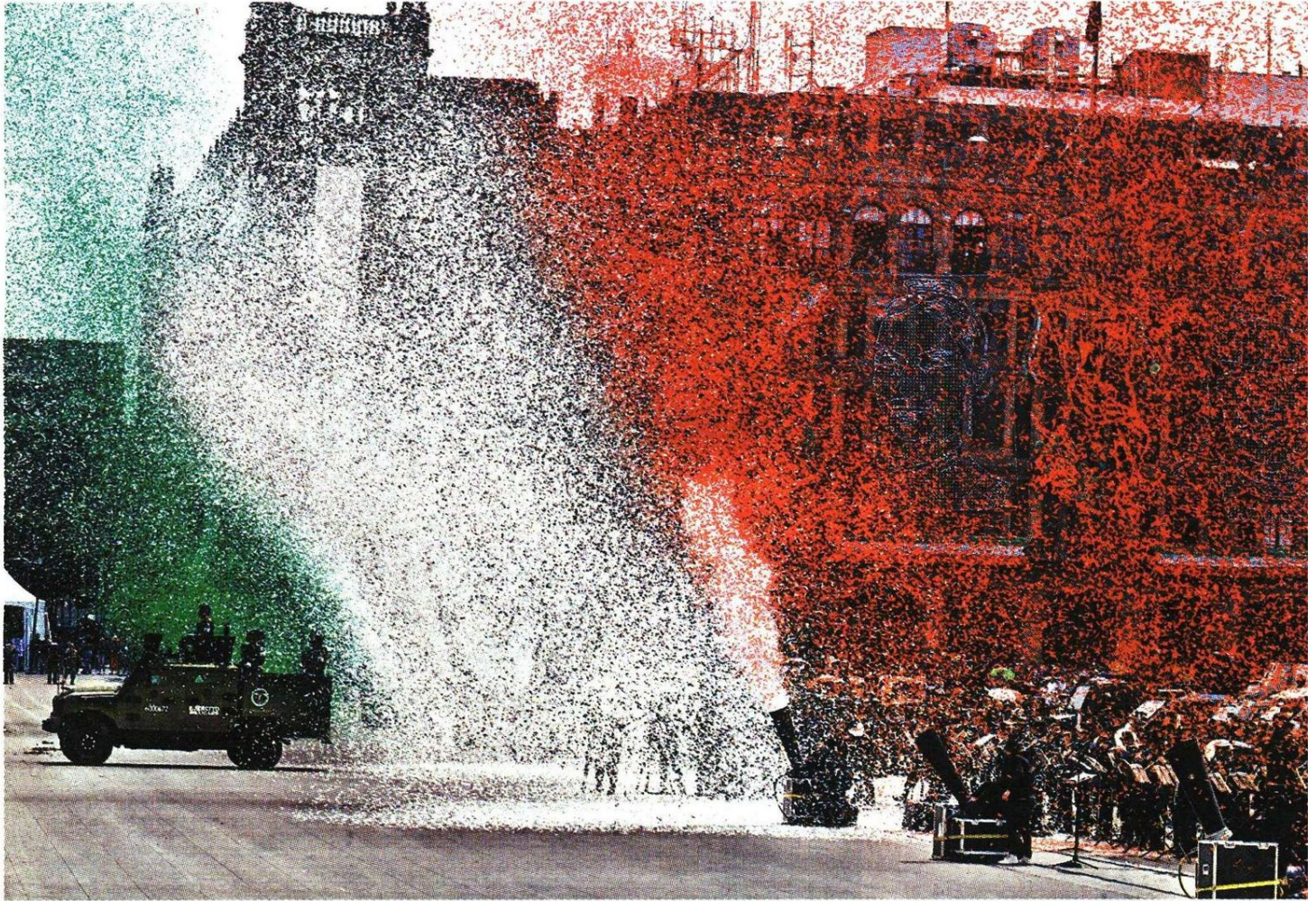
Sorpresas en tierra y aire durante la exhibición de las fuerzas armadas y su recorrido del Zócalo al Campo Marte.

Desfile. Sandoval y Ojeda agradecen a AMLO y ratifican subordinación a Sheinbaum; reúnen Grito y parada militar a unas 400 mil personas RUBÉN MOSSO Y ALMA PAOLA WONG, CDMX, PÁGS. 4, 6 Y 7