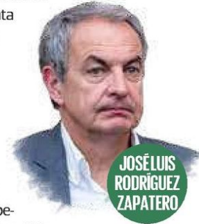
JOSÉ LUIS RODRÍGUEZ ZAPATERO

rusas con quienes servía de enlace comercial en distintos rubros venezolanos y que impidió la entrada de compañías de otros países. Tras años de contracción, el país enfrenta déficits estructurales en energía, infraestructura y salud. Y es que el sector sanitario, léase hospitales, diagnóstico, insumos y dispositivos médicos, concentra una demanda urgente que no puede esperar ciclos largos de inversión pública.