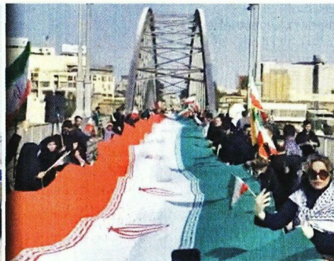
En Irán, cadenas y escudos humanos fueron desplegados el martes en centrales eléctricas y puentes en las horas a previas a que se cumpliera el plazo de Trump para la destrucción masiva.