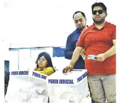
Los votantes débiles visuales podrán estar acompañados por alguien de su confianza o por un funcionario.