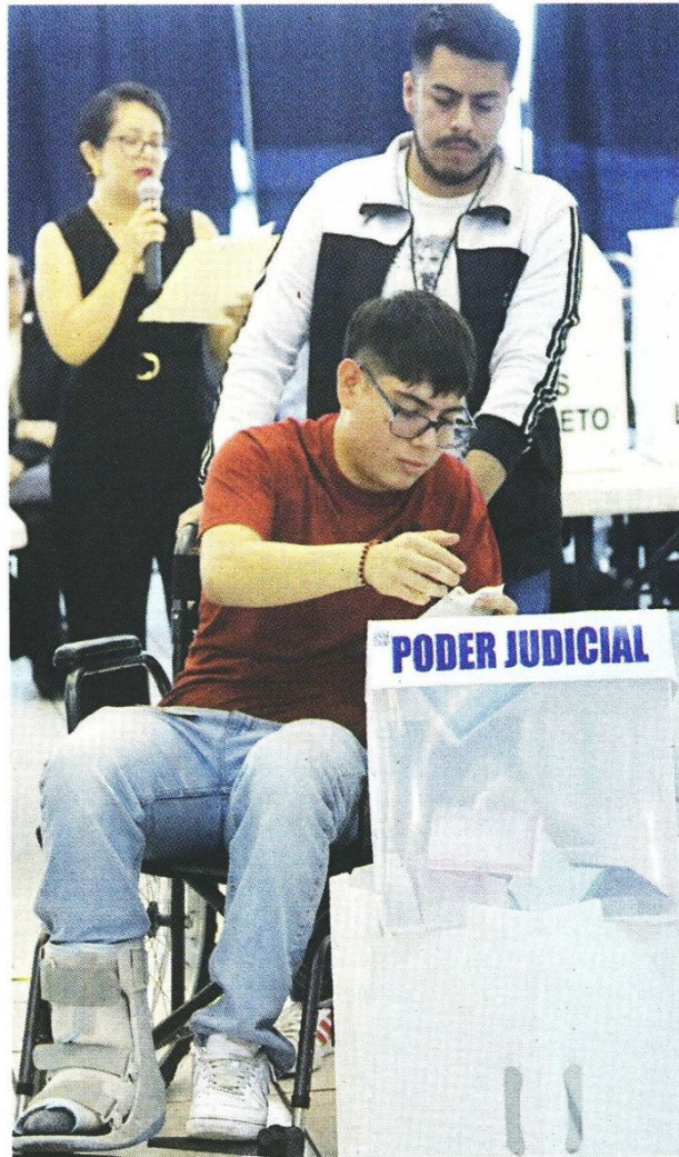
Las casillas están listas para recibir a personas en sillas de ruedas. Votarán en una mesa con una mampara.