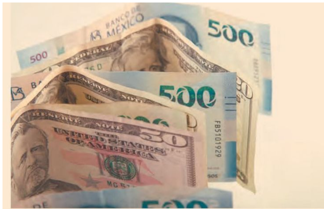
Los inversionistas están nerviosos ante las decisiones de Trump, lo que afecta la paridad del peso frente al dólar.