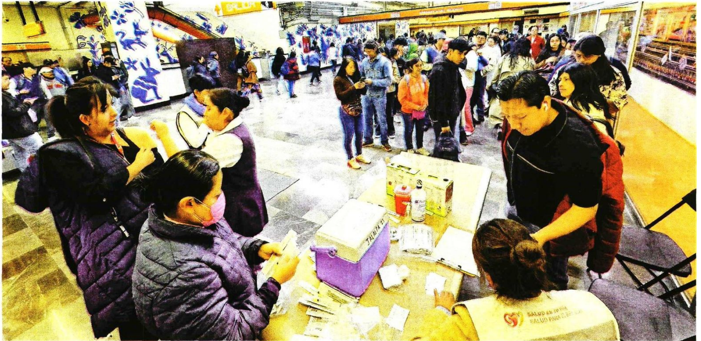
El país ha ampliado la campaña de vacunación luego de los miles de casos registrados.