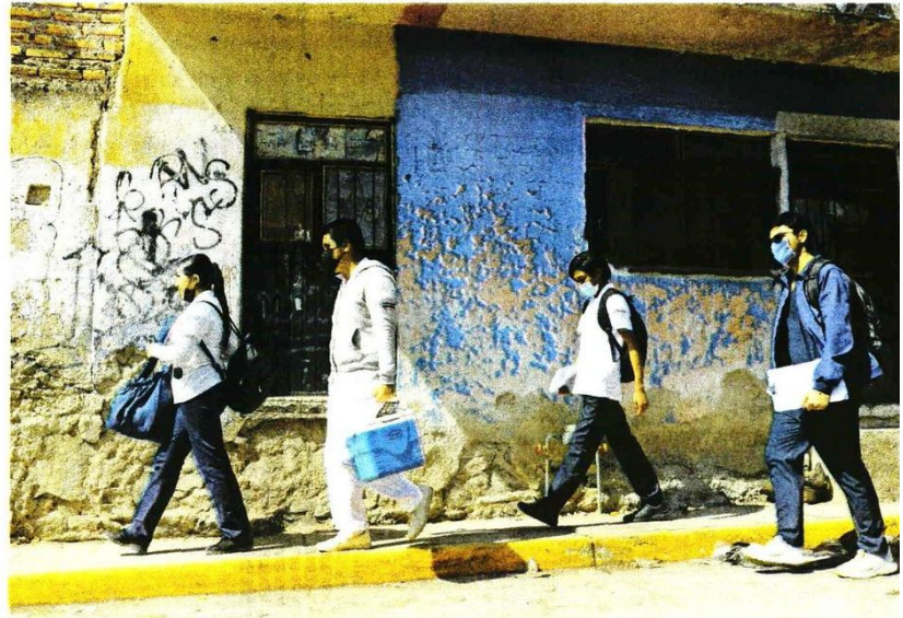
Brigadas han sido desplegadas por todo el territorio nacional.

Ante ello, la presidenta Claudia Sheinbaum adelantó que la próxima semana se presentará un programa ampliado de vacunación contra el sarampión, en respuesta al incremento de contagios registrado en el país y al llamado de alerta emitido por la OPS, con el objetivo de fortalecer la cobertura y contener la transmisión.