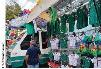
UNO de los puestos con mercancía pirata.