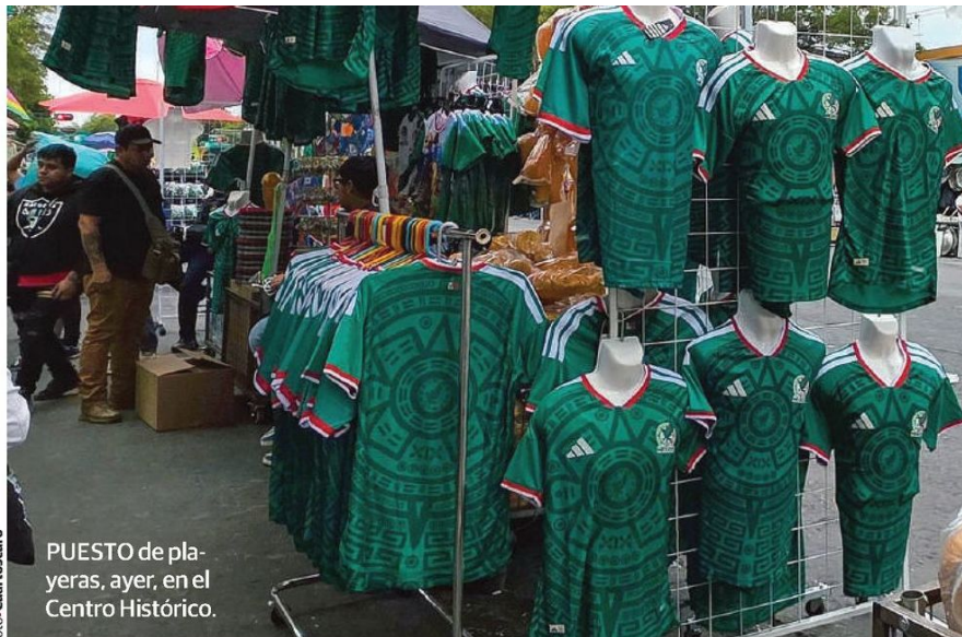
PUESTO de playeras, ayer, en el Centro Histórico.