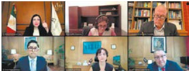
Conferencia. Funcionarios de Banxico en la presentación del informe trimestral.