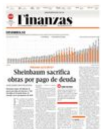
Gráfico: Alejandro Gómez