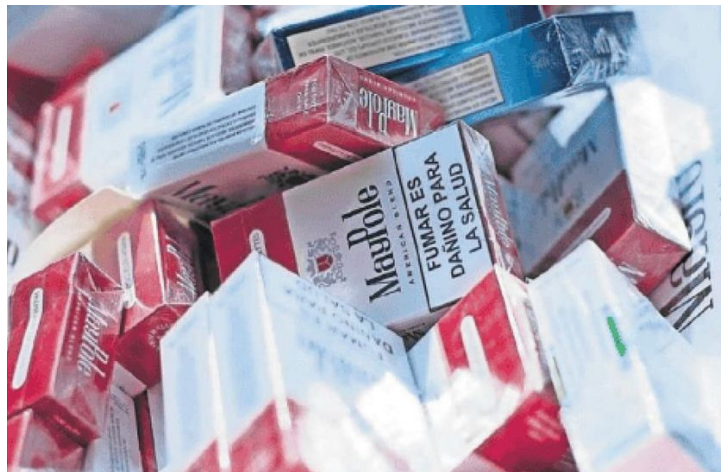
El tráfico ilegal de cigarrillos es una de las actividades por la que también optaron las organizaciones criminales para aumentar sus ingresos.