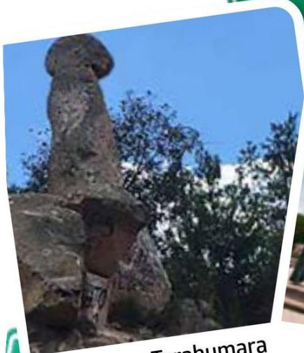
Creel Sierra Tarahumara