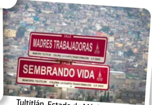
Tultitlán, Estado de México