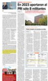
Para 2023, la cifra era de únicamente tres millones 605 mil 901.91 pesos, lo que evidencia la crisis del tricolor.