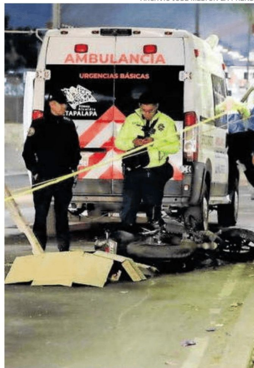
Los motociclistas son los más lesionados