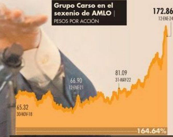
Grupo Carso en el sexenio de AMLO PESOS POR ACCIÓN