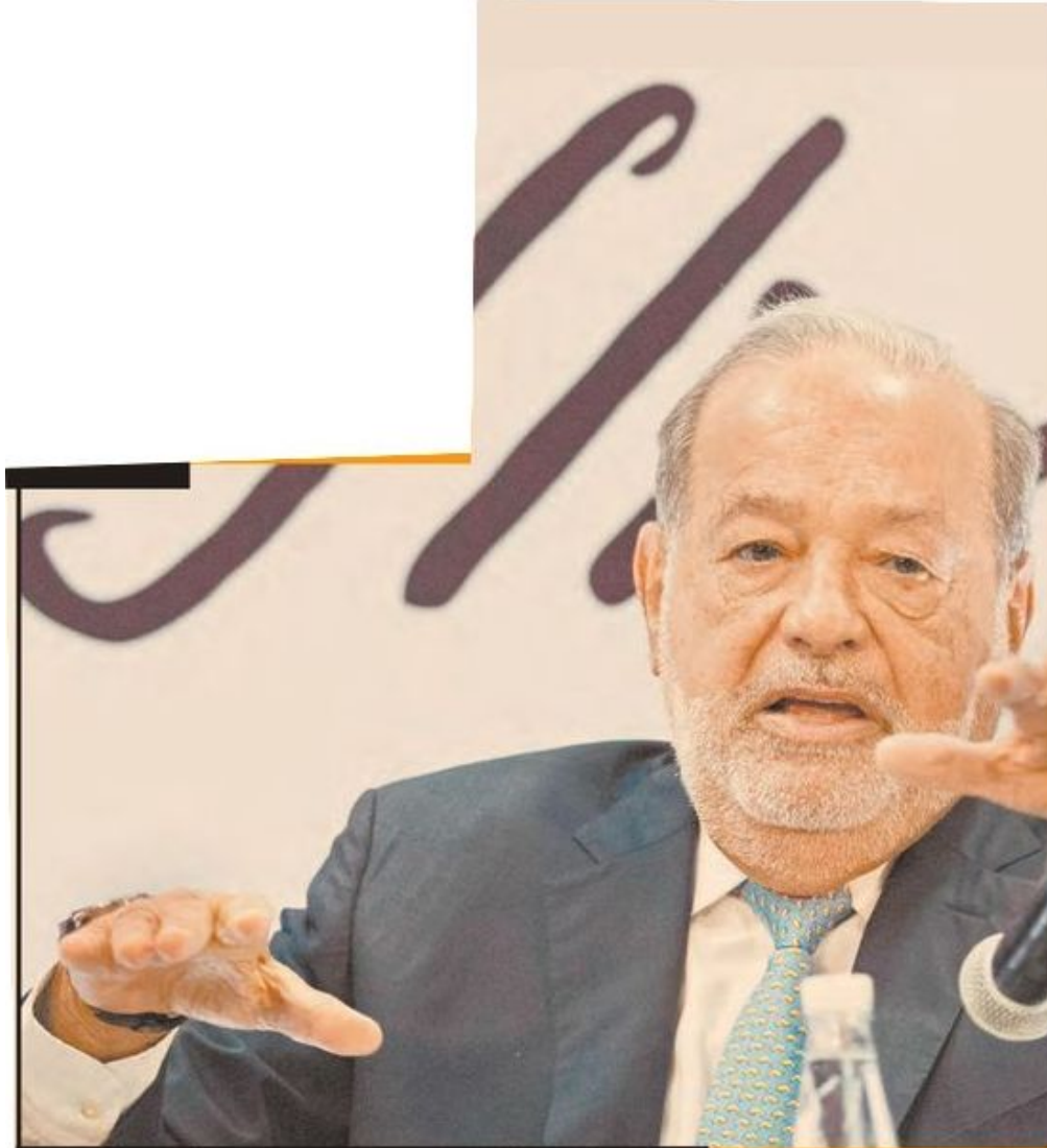
Carlos Slim Helú es el onceavo hombre más acaudalado del mundo, según la lista de multimillonarios de Bloomberg.

En conjunto, las tres compañías (Grupo Carso, América Móvil e Inbursa) han ganado 421,093 millones de pesos en valor de mercado durante el actual sexenio, para una capitalización conjunta de 1.65 billones de pesos.