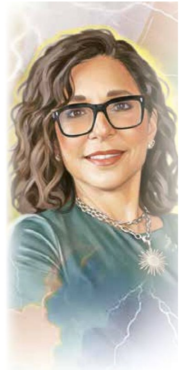
Ilustración: Erick Retana

El gobierno trabajará con el fiscal para investigar y perseguir infracciones cometidas por Grok, TikTok e Instagram.