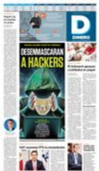
Ilustración: Jesús Sánchez

ALREDEDOR DE 200 AFILIADOS AL GRUPO CIBERCRIMINAL FUERON DADOS A CONOCER POR LAS AUTORIDADES INTERNACIONALES, Y HA COMENZADO SU CACERÍA > 7