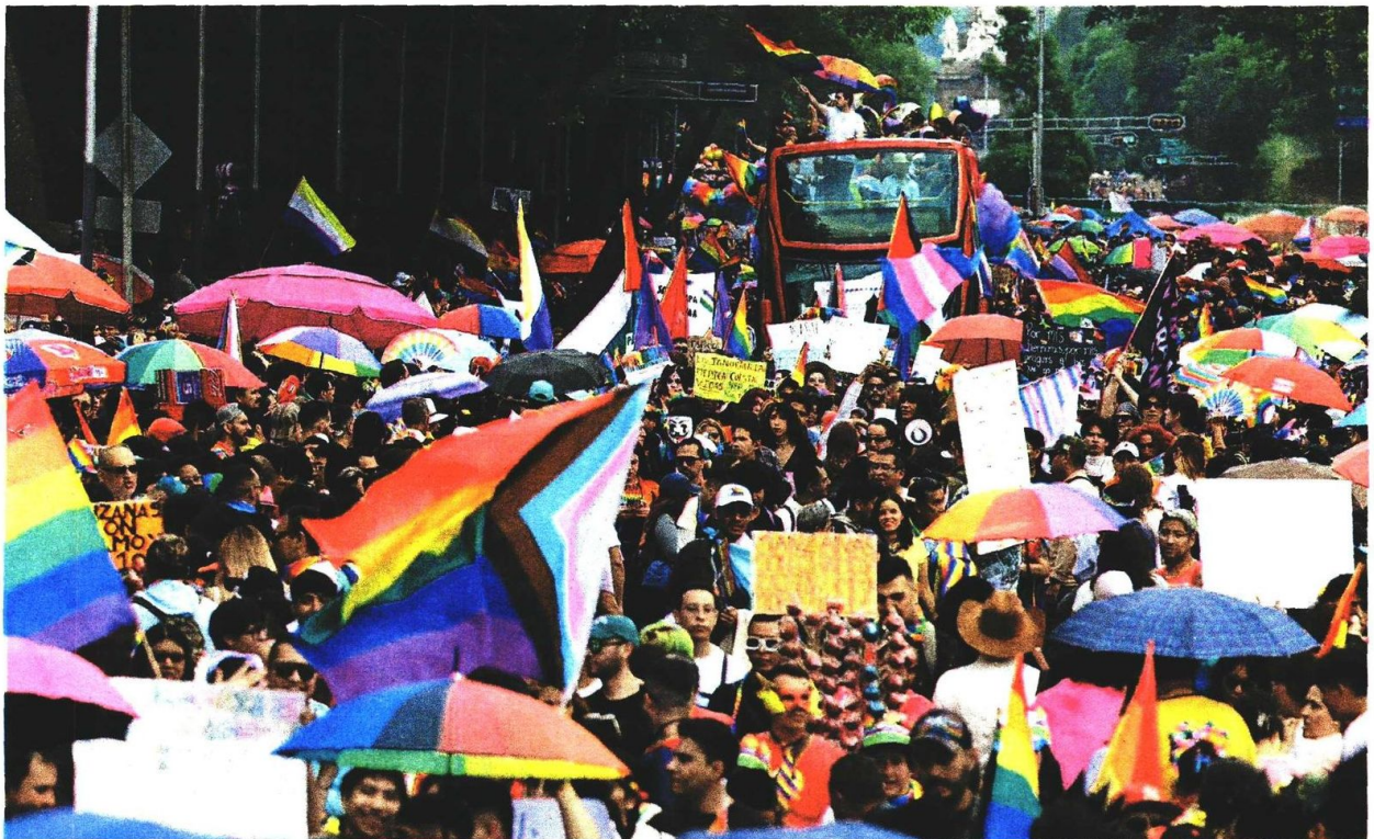
La 47 edición de la marcha LGBTQ+ partió a las 12:00 horas de ayer del Ángel de la Independencia al Zócalo capitalino