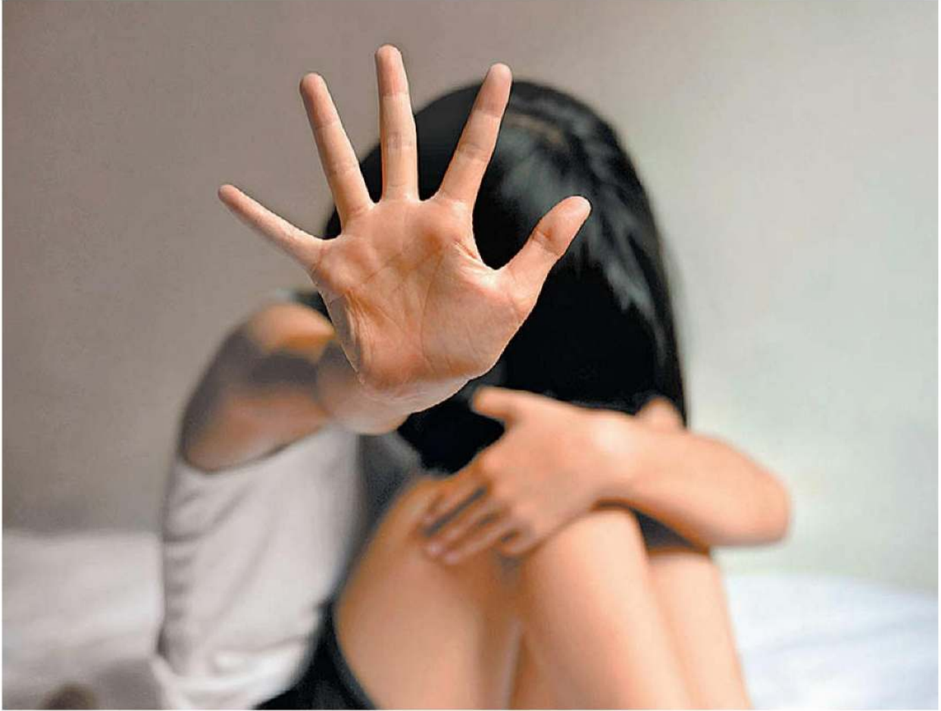
Los delincuentes chantajea a sus víctimas con enviar el material a sus familiares.