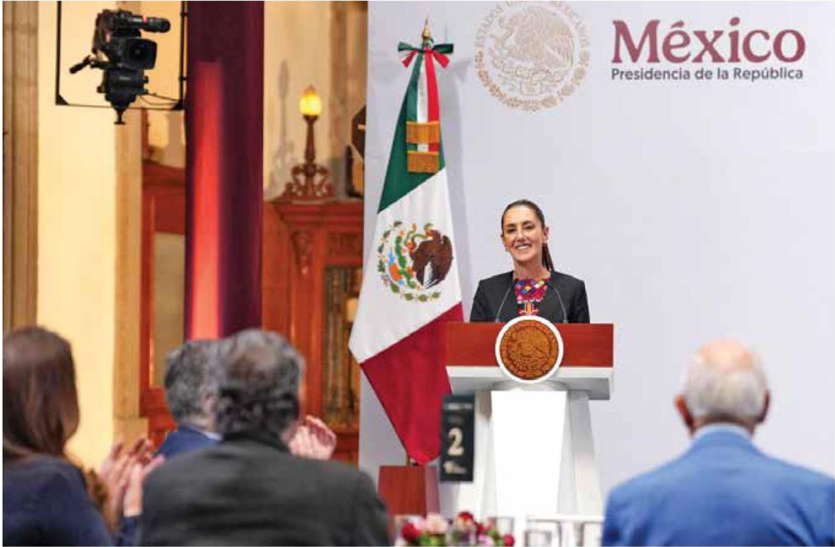
REUNIÓN. La presidenta Claudia Sheinbaum se reunió con líderes sindicales en Palacio Nacional.