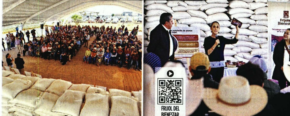
EN LA OLLA. En Zacatecas se prevé instalar una planta de producción para mejorar la semilla del frijol, duplicar su producción y procesarlo para darle valor agregado. El Gobernador David Monreal atestiguó el anuncio del programa.