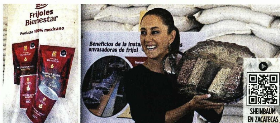
La Presidenta anunció el nuevo producto y sus presentaciones en bolsas y latas.

En febrero, durante una gira por Durango, la Presidenta reconoció que, como consecuencia de la sequía de los últimos años, cayó la producción de frijol, por lo que México importa 300 mil toneladas al año, de las cuales el 75 por ciento viene de EU.