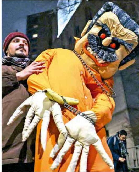
A las afueras del tribunal de Nueva York, venezolanos se manifestaron contra el expresidente.

El chavista está señalado de conspiración para cometer narcoterrorismo; conspiración para enviar cocaína a EU; posesión de dispositivos destructivos; conspiración para poseer armas.